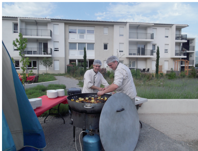
Quand les chefs s'affairent!

D'autre part nous recherchons des joueurs de belote pour jouer avec deux résidentes une fois par semaine.