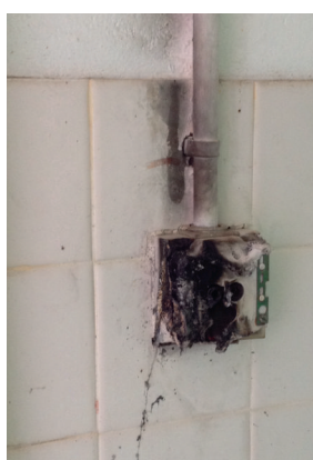
Du Grand Champ aux toilettes publiques, une bien triste dégradation.

Adopter une attitude responsable et citoyenne du bien public est l'affaire de tout un chacun. Une implication à tout niveau, des acteurs institutionnels, justice, forces de l'ordre, associations, est possible.