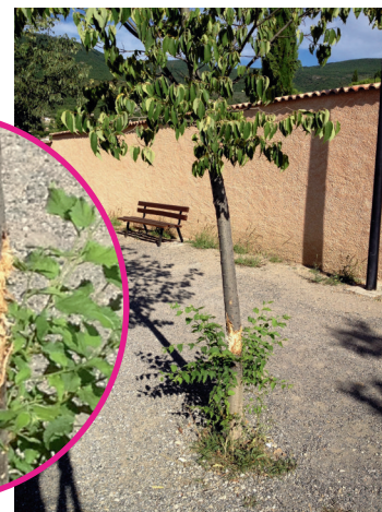
Faut il être indigne pour blesser un arbre