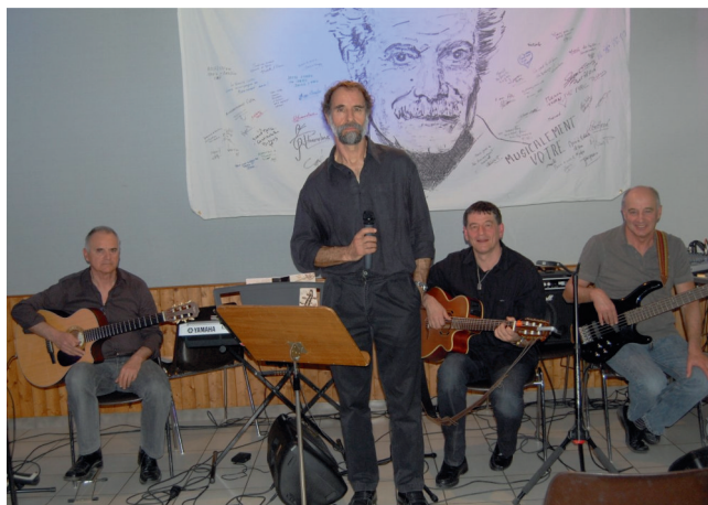
Pour les amoureux des bancs publics...