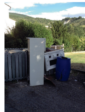
Un abandon qui coûte à tous.

Ces 5000 € seront payés par l'ensemble des contribuables peipinois.